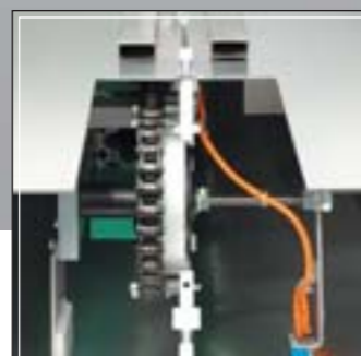
Cinta de alimentación con cadena lateral Infeed conveyor with side mounted chain Convoyeur d'alimentation avec chaîne latérale