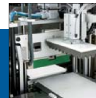
Grupo de soldadura y corte transversal LTS LTS Transversal sealing and cutting unit Groupe de soudure et coupe transversale LTS