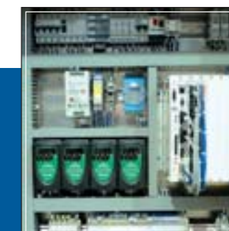
Cuadro eléctrico con PC industrial Electrical panel with industrial PC Panneau électrique avec PC industriel