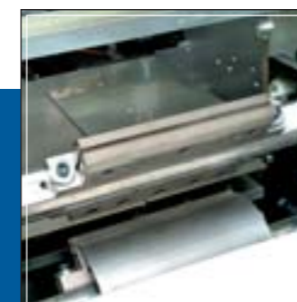
Grupo de soldadura y corte transversal RT RT Transversal sealing and cutting unit Groupe de soudure et coupe transversale RT