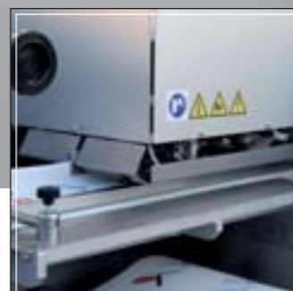
Grupo de soldadura longitudinal Longitudinal sealing group Groupe de soudure longitudinale