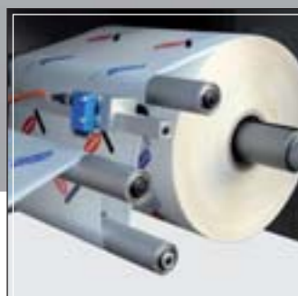
Portabobinas con regulación para centrado bobina Reel holder with reel edge alignment device Porte bobines avec régulation du centrage du film