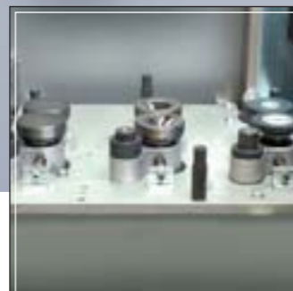
Grupo de soldadura longitudinal Longitudinal sealing group Groupe de soudure longitudinale