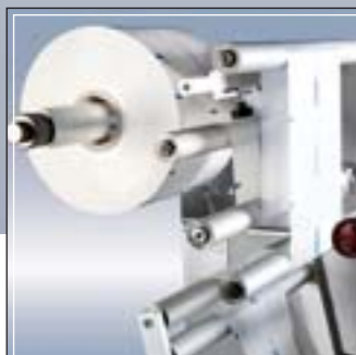
Portabobinas con regulación para centrado bobina Reel holder with reel edge alignment device Porte bobines avec régulation du centrage du film