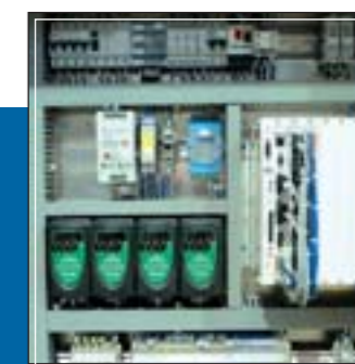
Cuadro eléctrico con PC industrial Electrical panel with industrial PC Panneau électrique avec PC industriel