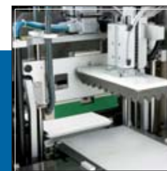
Grupo de soldadura y corte transversal LTS LTS Transversal sealing and cutting unit Groupe de soudure et coupe transversale LTS